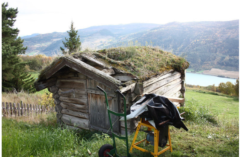
Hønsesus, tidl stall