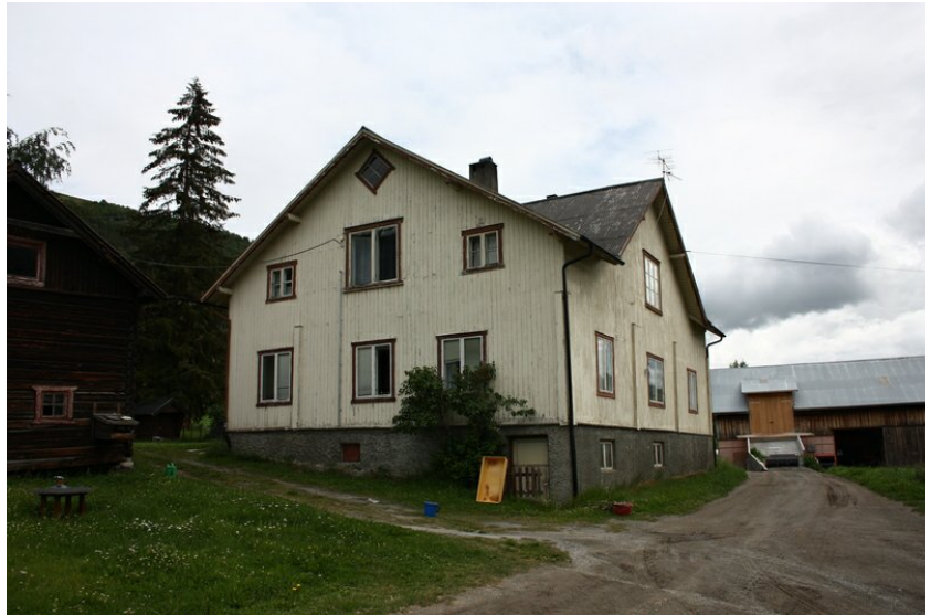
Tidlegare hovudhus 1910