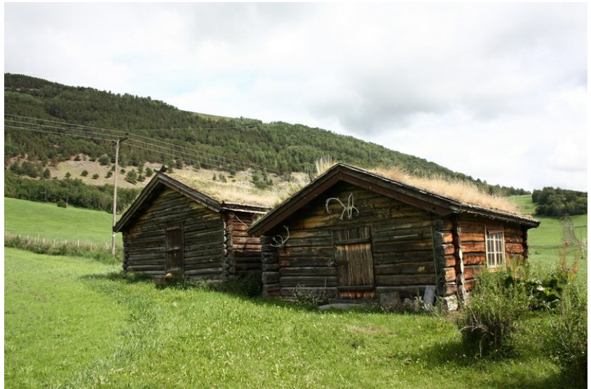
Eldhus og snikkerverkstad