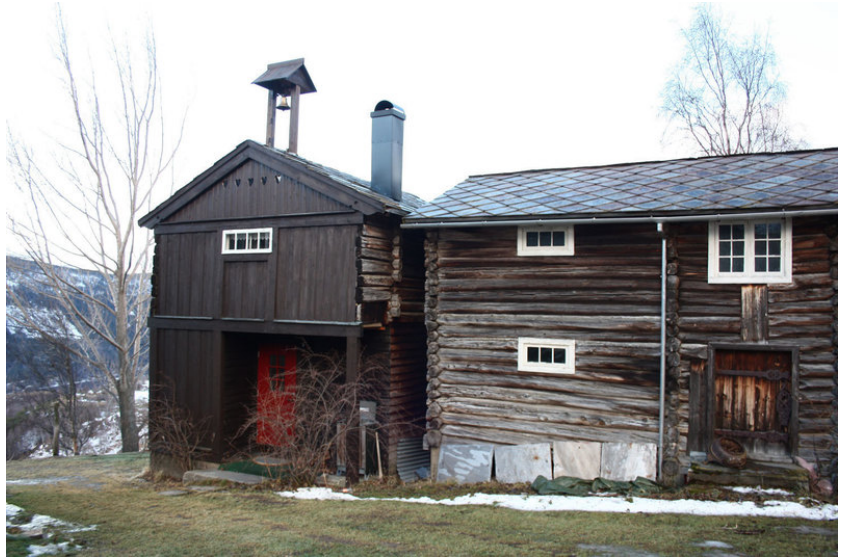
Eldhus med loft