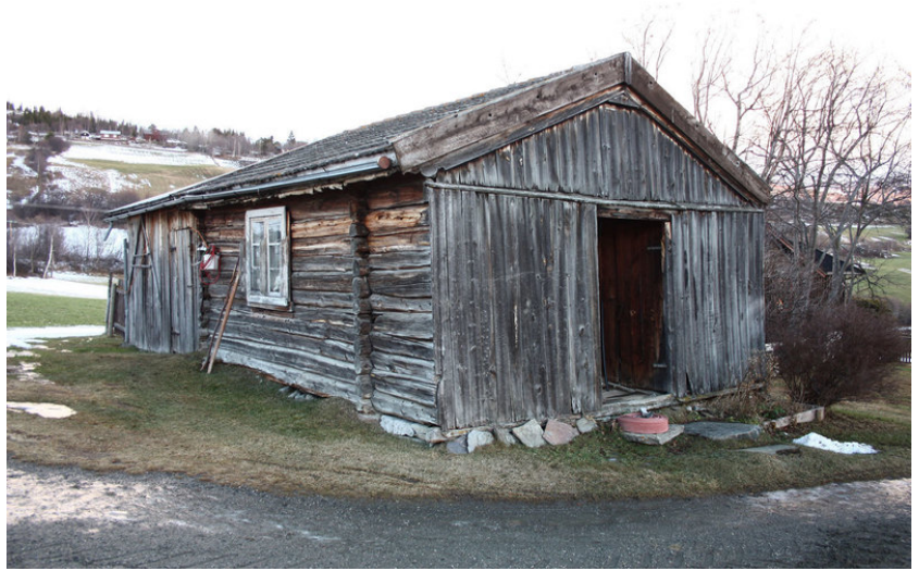
Tørrstugu frå Lye, her brukt som stugu.