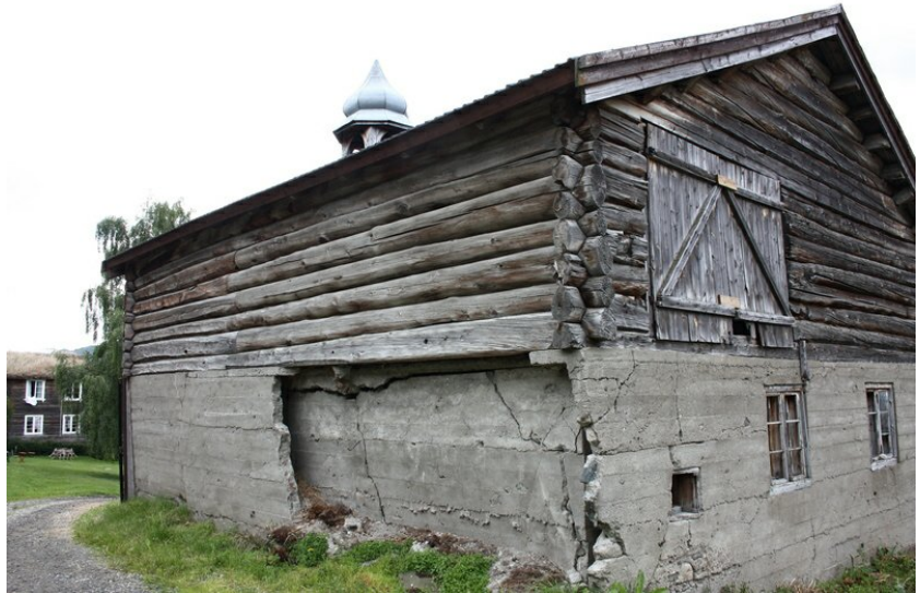
Øvre hjørne stall. Stall-rommet truleg støpt i 1938.