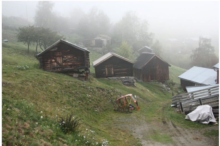
Stall nærast, småfefjøs nedanfor.