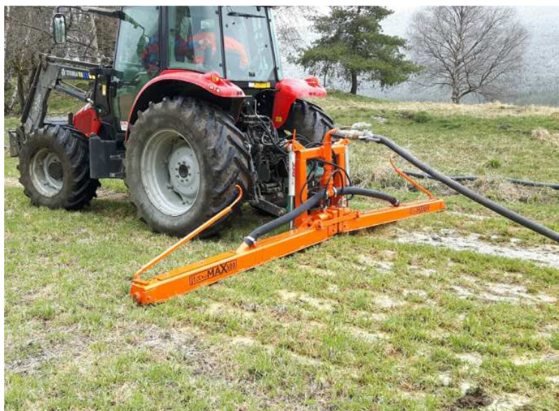
Frå husdyrgjødselselfagdag, Nitromax 500, nedfellingsutstyr frå Siljehaugen på Dovre

Dersom det blir for lite midlar vil det måtte gjerast ei prioritering av søknadene.