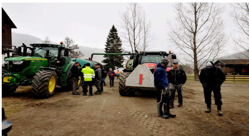
Husdyrgjødseldemonstrasjon på Søre Stae 10. mai