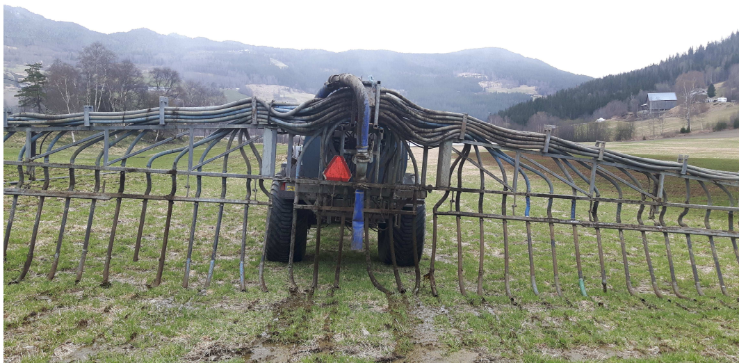
Stripespreiing i kaldt vårvêr

Heile ordninga med kommunalt tilskottsfond med regelverk ligg på heimesidene til Sel og Vågå.