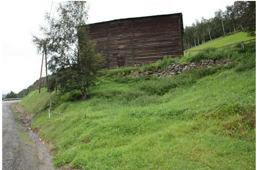
Treskelåve 7,4 x 15,2 m