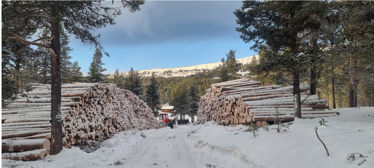
Skogdrift i Langmorkje Almenning

Ordninga gjeld for motormanuell drift med traktor og vinsj og omfattar rundvirke av gran og furuvirke som er levert for sal, innrapportert til VSOP-basen. Minste kvantum er 40 m 3 . Lilengda må vere minst 50 meter og ha gjennomsnittleg helling minst 40%. Tilskot blir berre gjeve i område som er avsett til landbruksformål i arealplanen og som fortsatt skal brukast til skogbruksformål. Det er eit vilkår at det vert sørgja for tilfredsstillande forynging av hogstfeltet. NB! Drifta skal førehandsgodkjennast av kommunen.