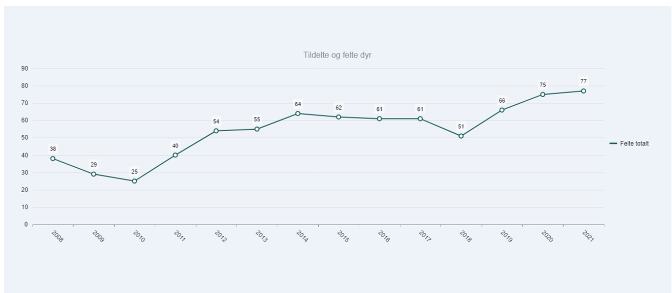
Figur 2. Figur som viser felt hjort frå 2008 og fram til og med 2021 innanfor Vågå kommune.

Innanfor Vågå sør har det vore aukande uttak av elg i dei seinare år. Totalt 134 felte dyr i perioden 2011-2013, 161 dyr i 2014-2016 og 183 dyr i perioden 2017-2019. Målet framover er generelt å ikkje la bestanden bli større enn i dag, og følgje opp med kvoter som dei tre siste åra, eventuelt med ein liten auke. Når det gjeld hjorten så har bestanden vore i vekst i fleire år, spesielt på fremre del av Heimfjellet. I dei seinare år ser det ut til at bestanden har stabilisert seg noko. Det er likevel lokale variasjonar frå år til år. I perioden 2011-2013 vart det felt totalt 80 dyr, i