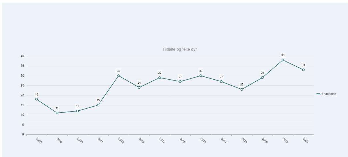
Figur 6: Felt hjort innanfor Vågå/Sel nord.

Som det kjem fram av statistikken så er det behov for å endra forskrifta. Det er store skilnader innanfor kommunen når det gjeld fordeling av hjort og elg, og kommunen er delt i to årsleveområde. Kommunedirektøren meiner at det framleis er fornuftig å dele kommunen i to område og fastsette ulikt minsteareal for Vågå nord for Otta elv og Vågå sør for Otta elv. Bestanden av elg er meir stabil innanfor Vågå sør enn innanfor Vågå Nord. Der har bestanden auka mykje frå 2008 og fram til i dag, noko felt elg viser.