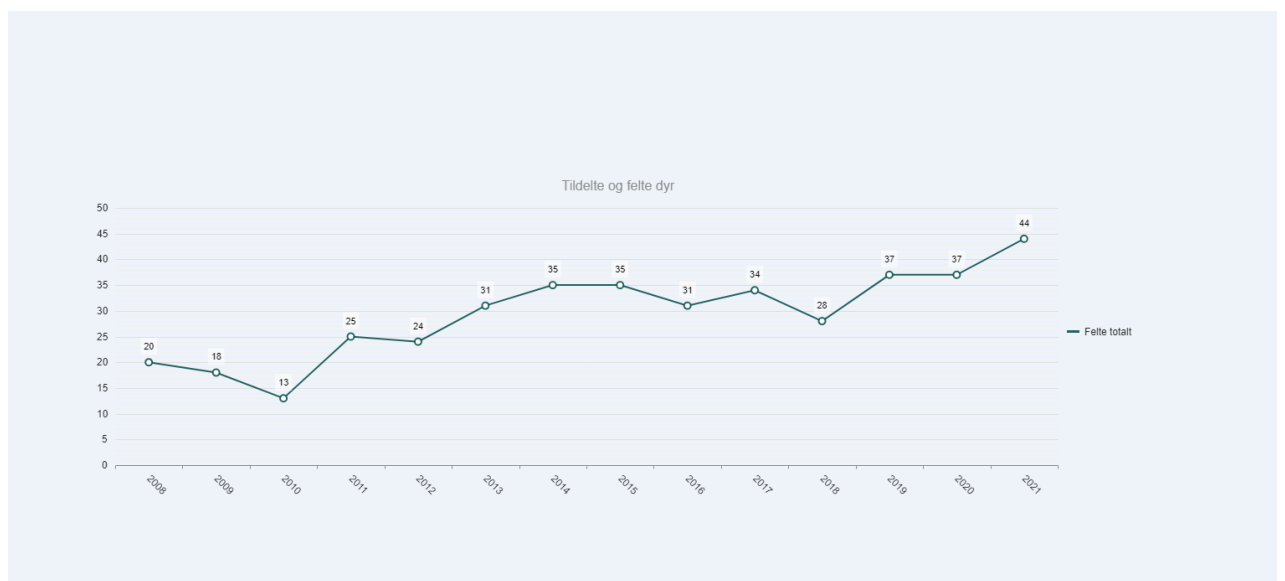
Figur 4. Felte hjort innanfor Vågå Sør.

Innanfor Vågå/Sel nord vart bestandsplanen for perioden 2015-2019 revidert eit år før tida fordi årleg uttak av elg var høgare enn det bestandsplanen opna for. I ny bestandsplane for 2019-2022 vart årleg uttak sett til 45 dyr fordi bestanden er i vekst og det er ein del beiteskadar på dyrka mark. Når det gjeld hjort så har bestanden vore i vekst i fleire år, men utbygging av Nedre Otta verka inn på trekket slik at avskyting gjekk ned i den perioden. Etter at utbyggingsperioden er over har hjorten igjen tatt i bruk gamle trekkvegar og årsleveområde og det er mykje hjort i området.