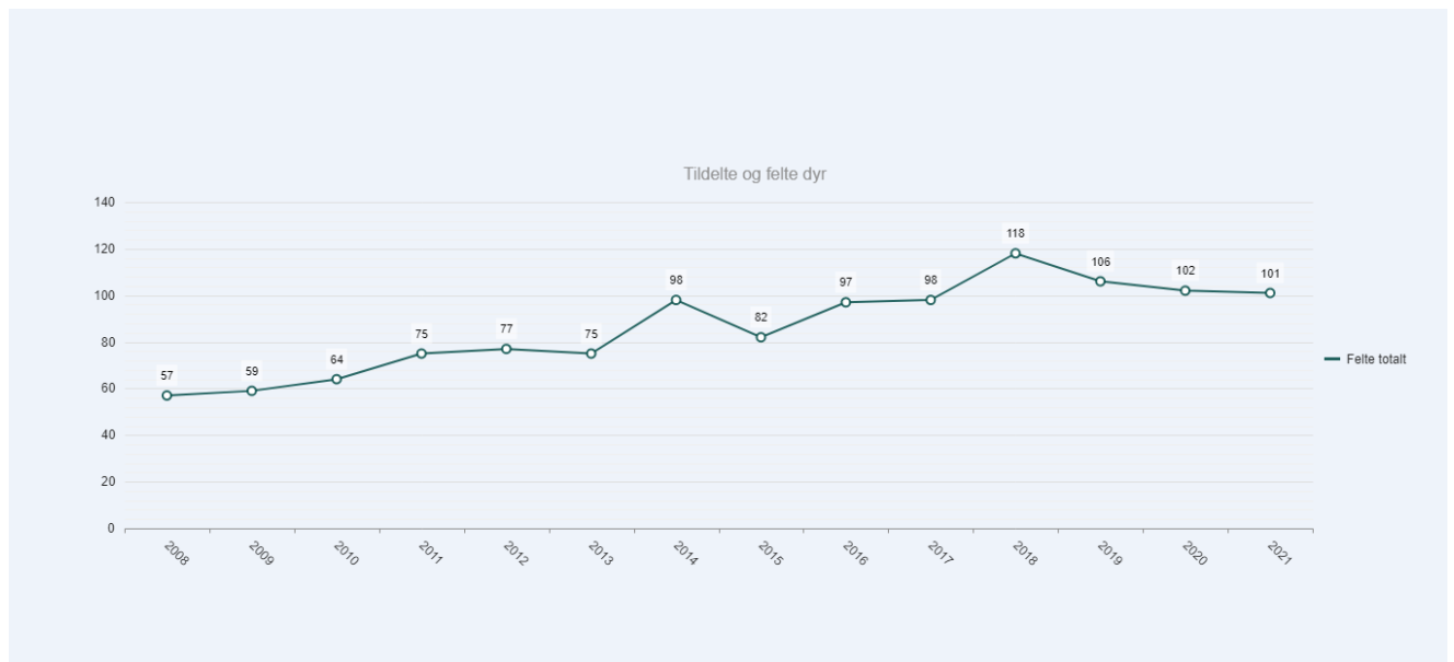
Figur 1: Figur som viser felt elg frå 2008 og fram til og med 2021 innanfor Vågå kommune.

Bestanden av hjortevilt verkar framleis å auke i kommunen etter fleire år med høg avskyting. Statistikk levert frå jegerane via sett-hjort skjema, samt statistikk over felte dyr, viser at Vågå kommune har ein stor bestand av elg og hjort.