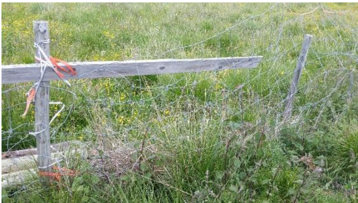
Bilete som syner døme på ulovleg gjerde.

Viss søknaden gjeld fellestiltak med fleire aktørar, skal ein deltakar stå som ansvarleg søker og sende søknaden på vegne av alle deltakarar, basert på skriftleg fullmakt.