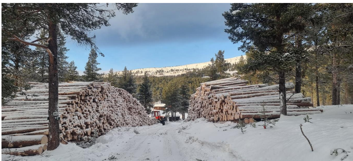
Skogdrift i Langmorkje Almenning vinter 2023

NB! Drifta skal førehandsgodkjennast av kommunen.